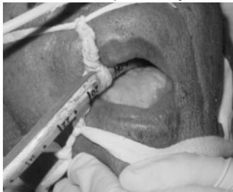
Figura 3: Paciente submetido à ventilação artificial apresentando saburra lingual.

Nos mais diversos problemas encontrados na cavidade oral dos pacientes intubados, a língua saburrosa (Figura 3), alteração relativamente comum e frequentemente visto nesses pacientes é formada basicamente por restos alimentares, células descamadas, bactérias, fungos e enzimas ativas que participam do processo da digestão. Pesquisas realizadas por universidades, onde foi comparada a remoção da saburra lingual feita com o auxílio de uma escova dental e com o limpador de língua mostraram que, 6 g de saburra lingual são removidas pela ajuda da escova dentária, enquanto o limpador de língua remove 1 g e não causa nenhum dano e desconforto durante essa remoção (SANTOS et al. , 2013).