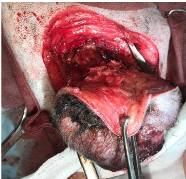
Figura 7 – Massa aderida em vértebra caudal