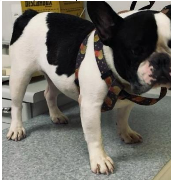
Figura 1 – Aparência do paciente do relato na 1ª consulta

Esse relato de caso se refere a um canino da raça Bulldogue francês de 8 anos de idade (Figura 1), atendido em uma clínica particular da cidade de Teresópolis. O animal estava com uma massa em região perineal percebida pelos tutores 4 semanas antes da consulta. Durante a consulta, observou-se uma formação ulcerada e aderida em região perineal (Figura 2). A massa estava aparentemente aderida em musculatura, e porção final da coluna, envolvendo vértebras caudais. O animal apresentou perda de peso e progressão rápida do tumor. A formação tinha características de inflamação intensa, porém o animal não apresentava dor à palpação local. Não foi possível a coleta de material para citologia, devido ao sangramento e inflamação. Optou-se por exérese cirúrgica da massa. Como exames pré-operatórios foram solicitados, ultrassonografia abdominal (Figura 3), radiografia torácica (Figuras 4, 5, 6), ecocardiograma e exames de sangue (Tabela 1).