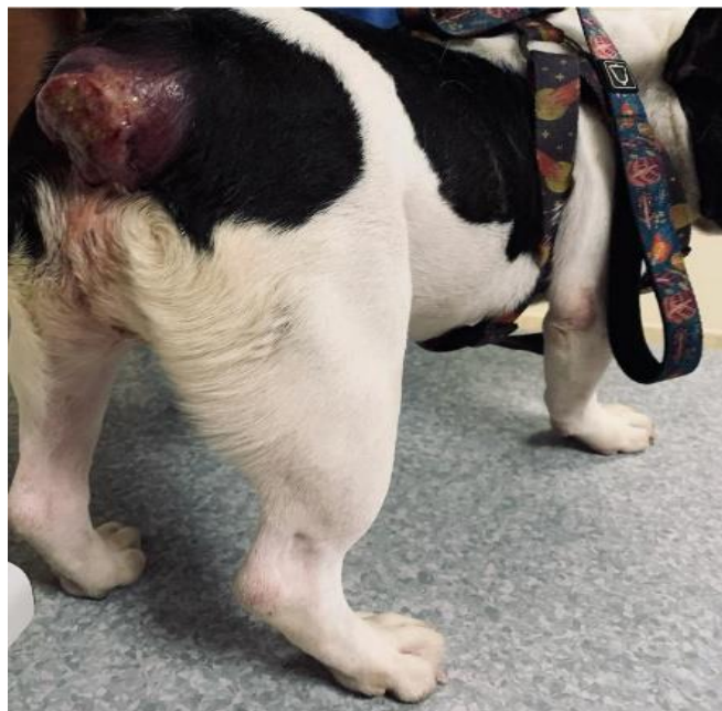
Figura 2 – Massa tumoral no paciente, em região perineal