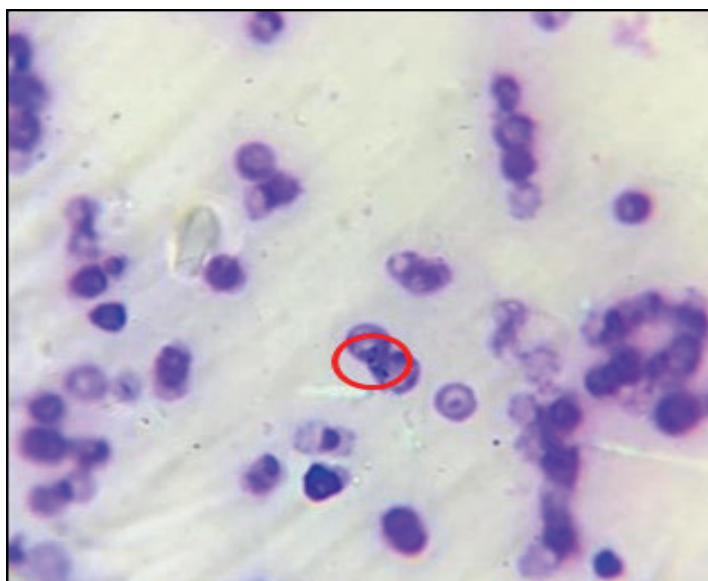
Figura 2 - Inclusão de Piroplasmídeo em hemácia (círculo vermelho) no foco de 1000x

O primeiro hemograma foi realizado no mesmo dia da avaliação clínica. Na série branca, os resultados observados dignos de nota foram: Leucocitose; Eosinopenia; Linfopenia e Neutrofilia severa. Quanto a série vermelha, não houve alterações em comparação aos valores de referência, porém, as plaquetas se demonstraram escassas, consolidando uma trombocitopenia. Ao decorrer da pesquisa de hemocitozoários através da lâmina no microscópio, foi encontrada a presença de inclusões com morfologia compatível com grandes piroplasmas da família Babesiidae (Figura 2).